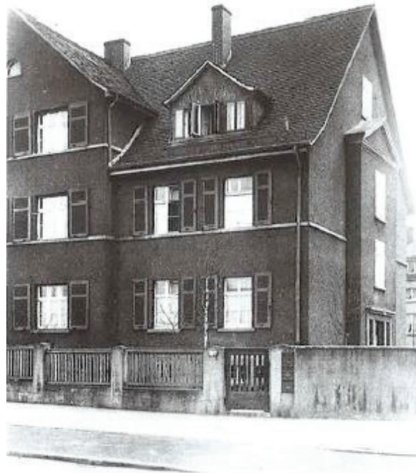
Het geboorte huis van Anne Frank, Marbachweg 307 in Frankfurt am Main (Duitsland).

Generaties lang wonen de families Frank en Holländer al in Duitsland. Het gezin Frank is liberaal-Joods. Zij voelen zich verbonden met de Joodse godsdienst, maar zijn niet streng gelovig. In 1930 is ongeveer 1% van de Duitse bevolking Joods, ruim 500.000 mensen.