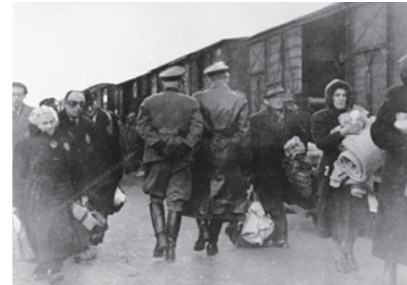
Westerbork is een kamp waar bijna alle Joden die in Nederland zijn opgepakt eerst naar toegebracht worden. In Westerbork zitten duizenden gevangenen.