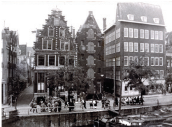
Een razzia in Amsterdam, 26 mei 1943.