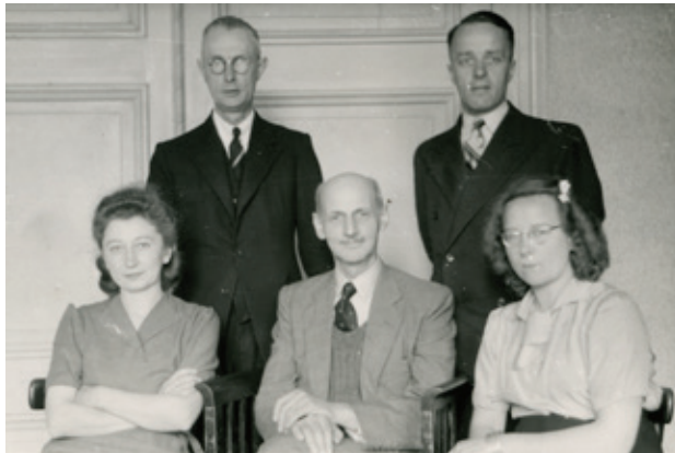
Otto met de helpers, oktober 1945. Van links naar rechts: Miep Gies, Johannes Kleiman, Otto Frank, Victor Kugler en Bep Voskuijl.