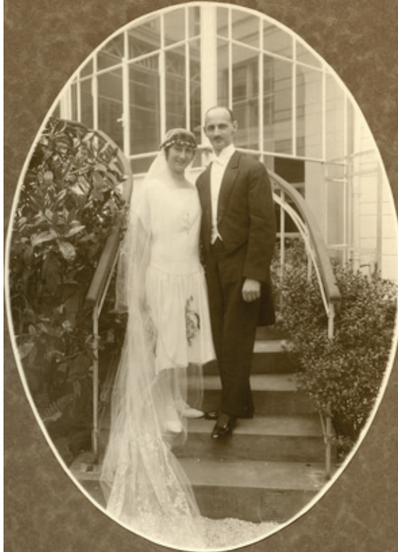
Het huwelijk van Otto Frank en Edith Holländer op 12 mei 1925.

Generaties lang wonen de families Frank en Holländer al in Duitsland. Het gezin Frank is liberaal-Joods. Zij voelen zich verbonden met de Joodse godsdienst, maar zijn niet streng gelovig. In 1930 is ongeveer 1% van de Duitse bevolking Joods, ruim 500.000 mensen.