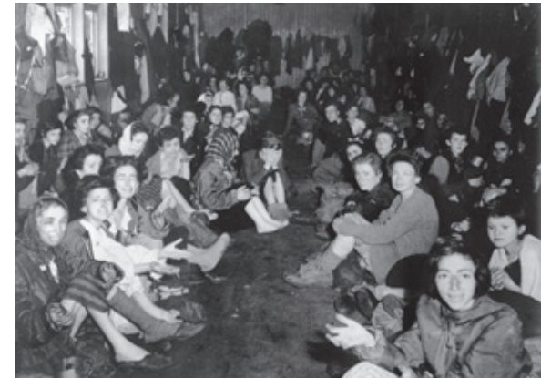
Overlevenden in het kamp Bergen-Belsen, april 1945. Na de bevrijding sterven nog veel mensen aan de gevolgen van hun gevangenschap.