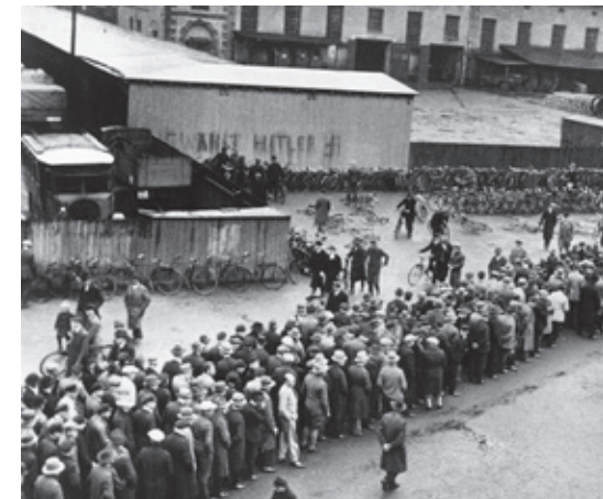
Werklozen in de rij voor het arbeidsbureau in Hannover, voorjaar 1932. Op de schutting staat: 'Kiest Hitler'.