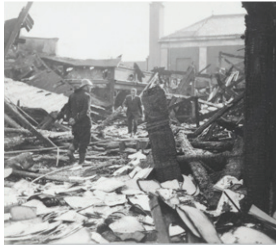
In maart 1943 plegen leden van het verzet een aanslag op het bevolkingsregister van Amsterdam, om het zo voor de nazi's moeilijker te maken om joden en leden van het verzet op te sporen. Slechts een klein deel van de administratie wordt verwoest. Anne noemt deze aanslag in haar dagboek.