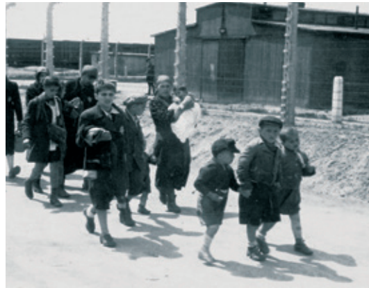
Joodse moeders en kinderen op weg naar de gaskamer in Auschwitz-Birkenau, mei 1944.