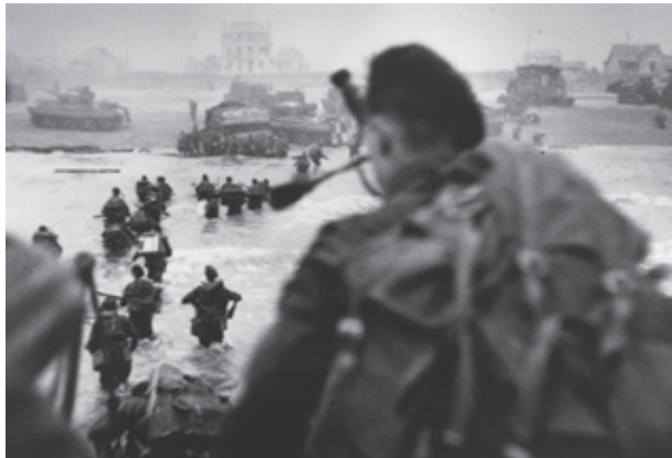
Op 6 juni 1944 landen geallieerde troepen op de stranden van Normandië in Frankrijk. Zij willen Europa van de nazi's bevrijden. Die dag wordt D-Day genoemd.