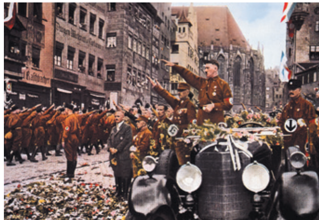
Adolf Hitler op de jaarlijkse partijdag in Neurenberg, 1927

In 1924 zit Adolf Hitler in de gevangenis. Hij is veroordeeld vanwege een mislukte staatsgreep. Hij schrijft zijn ideeën op in een boek, 'Mein Kampf' (Mijn Strijd). Nadat het boek uitgegeven is, wordt het op grote schaal verspreid.