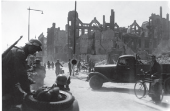
Duitse soldaten trekken het verwoeste centrum van Rotterdam binnen, mei 1940.