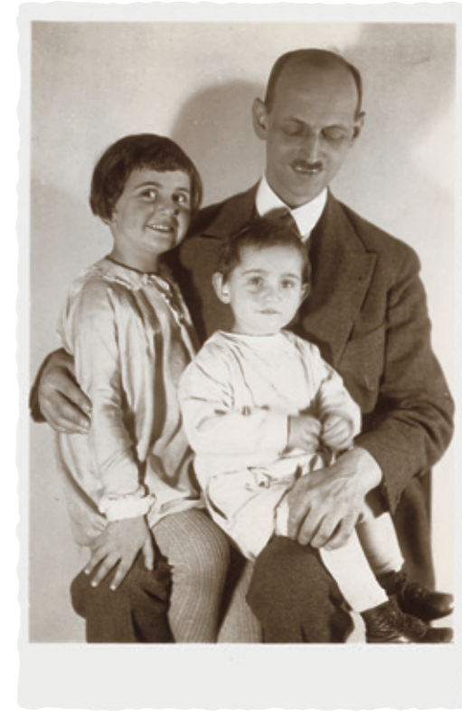
Margot, Anne en hun vader, augustus 1931.