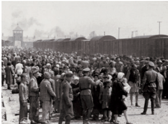
Joodse gevangenen uit Hongarije op het perron van Auschwitz-Birkenau, mei 1944.