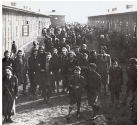
Kinderen in het doorgangskamp Westerbork, 1943.