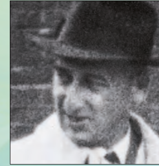
Херман Ван Пелс