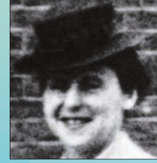
Аугуста Ван Пелс-Рутген