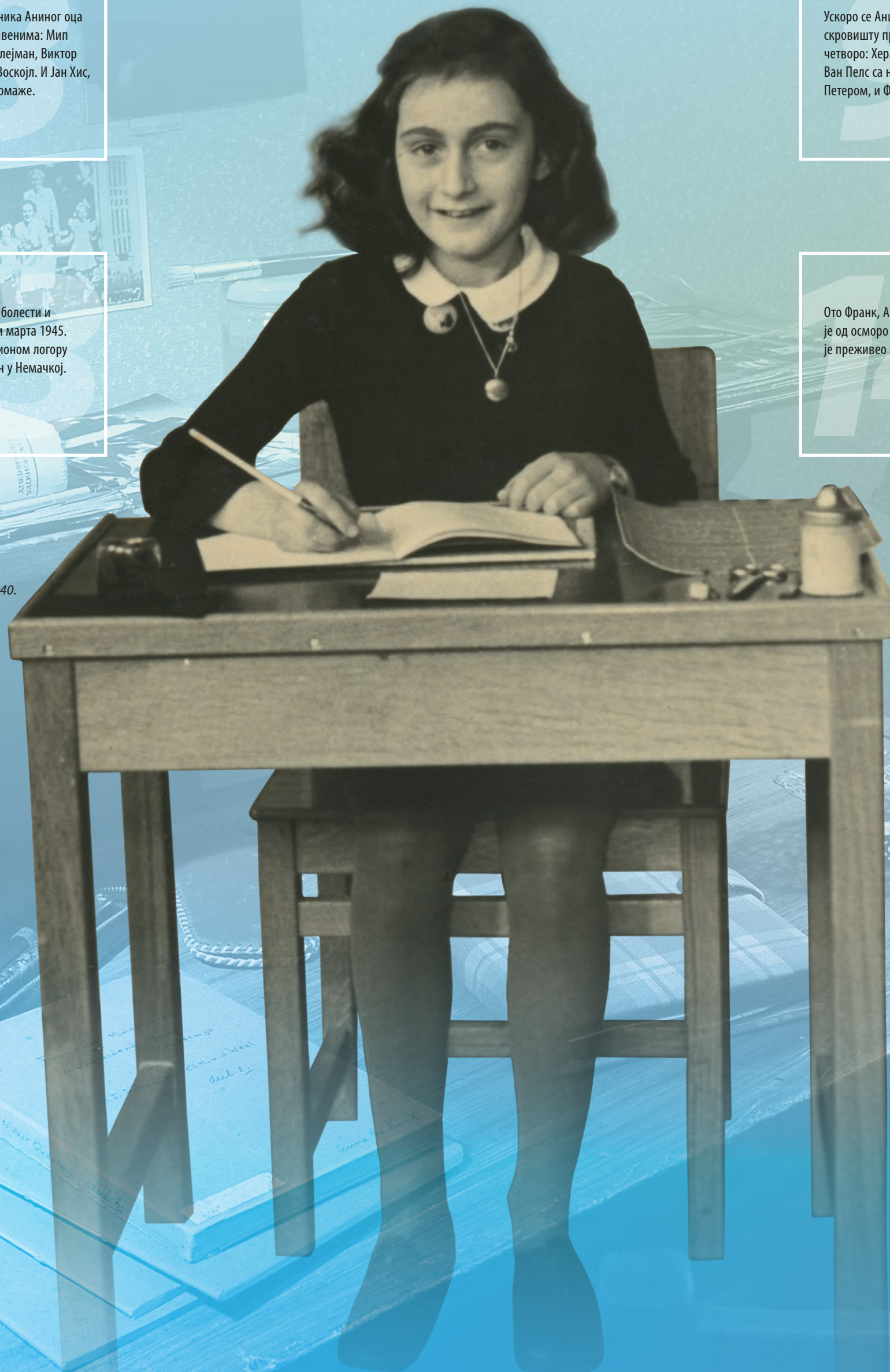
Ана Франк, 1940.

15 После рата, Ото Франк из Аниних записа у дневнику саставља књигу „Скровиште“.