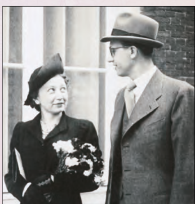
Мип Хис, 1909 – 2010 Јан Хис, 1905 – 1993

Ото Франк у писму Јад Вашему, 10. јуна 1971.